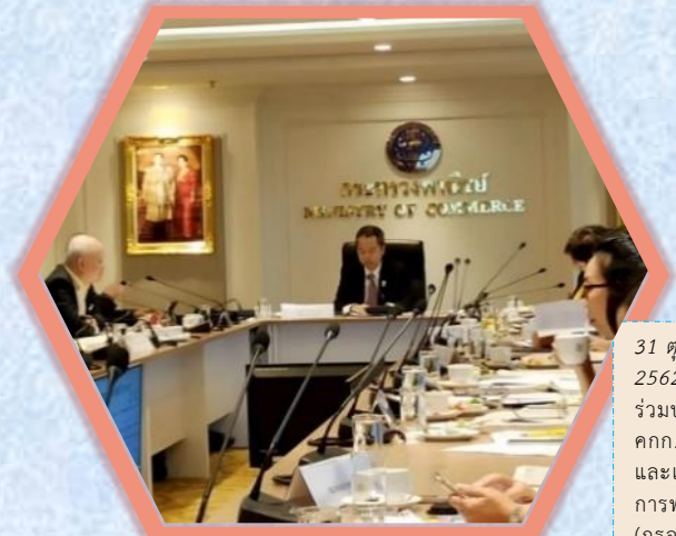
31 ตุลาคม 2562 TTIA เข้า ร่วมประชุม คกก. ร่วมภาครัฐ และเอกชนด้าน การพาณิชย์ (กรอ.พณ) อ่านต่อหน้า 2