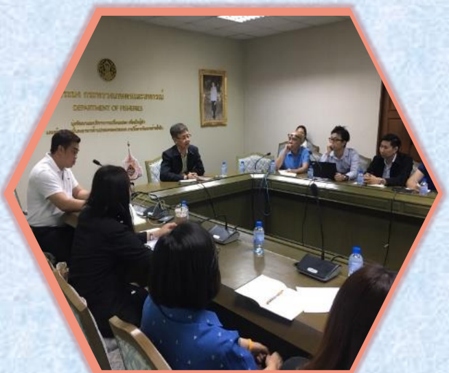
21 พ.ย. 2562 TTIA และ Tuna traders เข้าร่วมประชุมหารือ กับกรมประมง เรื่อง การขอความร่วมมือในการออกเอกสาร ใบรับรองการจับสัตว์น้ำทั้งลำเรือ อ่านต่อหน้า 11