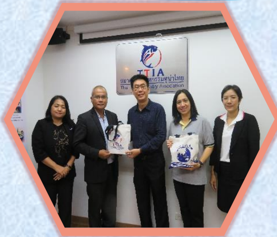
4 พฤศจิกายน 2562 สมาคมฯ จัดประชุม ฝ่ายเทคนิคครั้งที่ 3/2562, สัมมนาด้าน เทคนิค และการหารือ งานสมาคมการค้า อาหารสัตว์เลี้ยงไทย TPFA Thai Pet Food Trade Association อ่านต่อหน้า 3