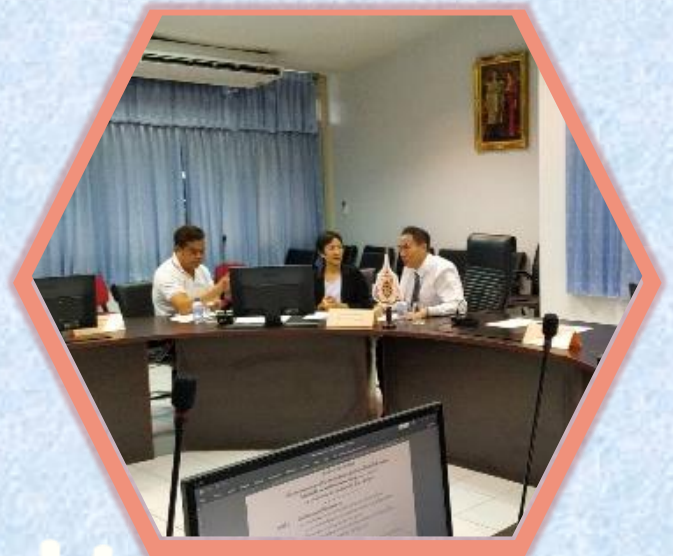
14 พ.ย. 2562 TTIA เข้าร่วมประชุมคณะกรรมการบริหาร จัดการทรัพยากรปลาอินทนน้าไทย ครั้งที่ 1/2562 โดย มีรองอธิบดีกรมประมงเป็นประธาน อ่านต่อหน้า 8