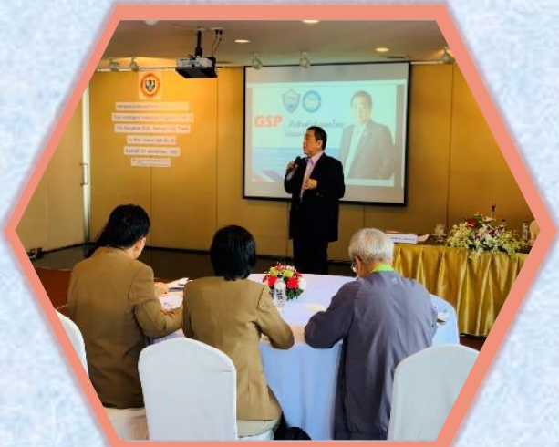
23 พฤศจิกายน 2562 ดร.พจน์ อร่ามวัฒนานนท์, รองประธานกรรมการ สภาหอการค้าแห่งประเทศไทย ได้บรรยายเรื่อง “GSP กับสินค้าส่งออกไทยไป อเมริกา” ให้กับผู้บริหารการอบรมหลักสูตร TIIP รุ่น 21 อ่านต่อหน้า 14