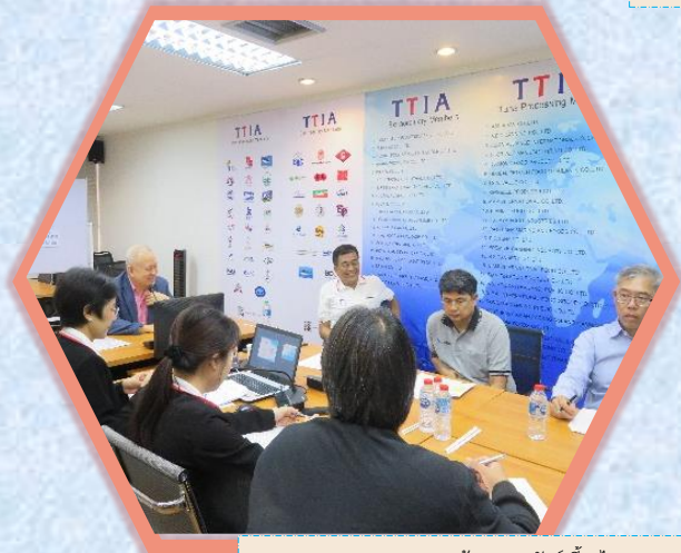
25 พ.ย.2562 สมาคมการค้าอาหารสัตว์เลี้ยงไทย (TPFA) ได้ จัดประชุมใหญ่สามัญประจำปี 2562 และเลือกตั้ง คณะกรรมการบริหาร ปี 2562-2563 อ่านต่อหน้า 14